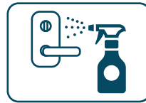
定期的な消毒の実施