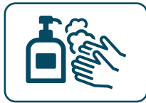
スタッフの 手洗い・消毒の実施

アートホテル青森では皆様にご安心にご利用いただけるよう感染防止の取り組みを行っております。