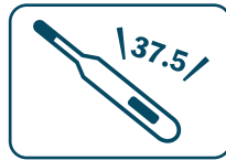
スタッフの健康チェック